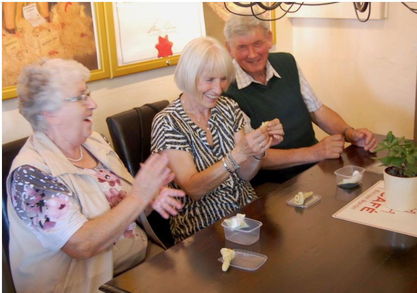
Fröhliche Stimmung beim Marzipanmodellieren in Lübeck

Lass Dich nicht vom Bösen überwinden, sondern überwinde das Böse mit Gutem. (Römer 12,21)