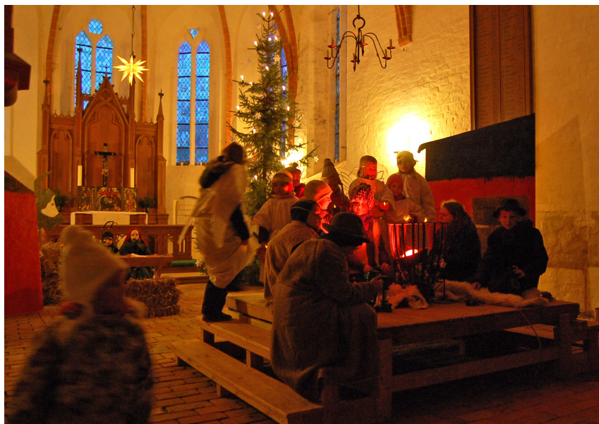
Das „wärmende Feuer“ beim Krippenspiel in Lüdershagen