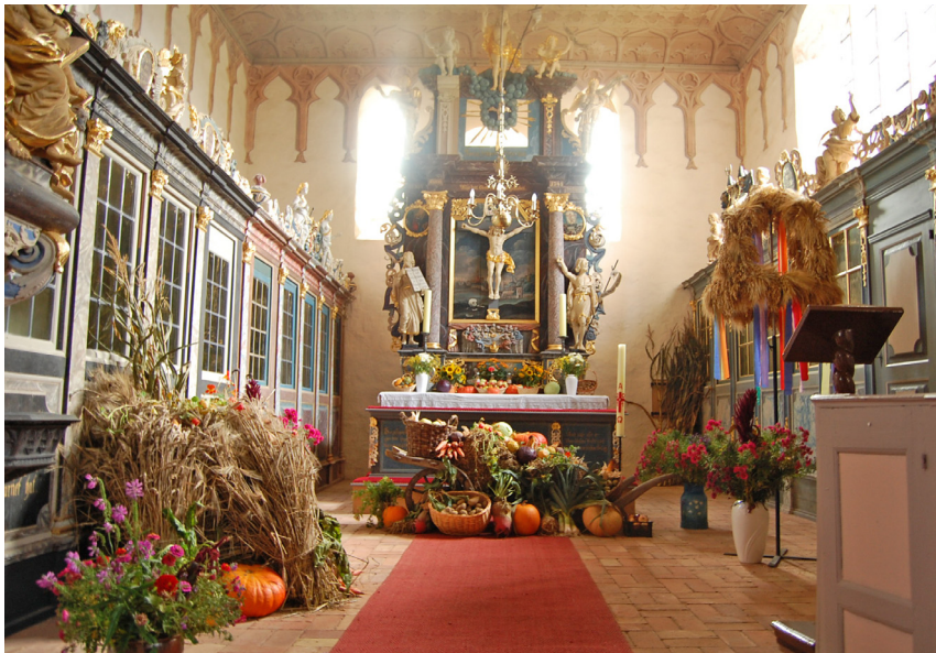
Der festlich geschmückte Erntedankaltar in der Dorfkirche zu Tribohm