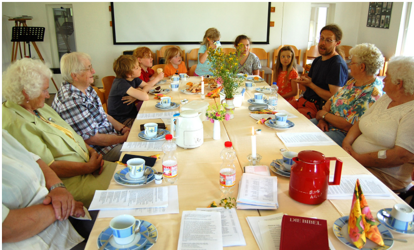
Jung und Alt beim gemeinsamen Gemeindegemeinschaftsabend in Ahrenshagen